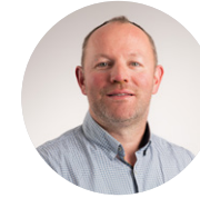
RÉGIS CLAVIER 11 e VICE-PRÉSIDENT EN CHARGE DE L'ACTION FONCIÈRE ET DE L'APPUI AU DÉVELOPPEMENT DU TERRITOIRE

Dossier spécifique du mandat : porter les enjeux identifiés par le schéma départemental de sécurisation de l'alimentation en eau potable : la sobriété, la reconquête de la qualité des ressources en eau, le développement des interconnexions entre les ressources, la recherche de nouvelles ressources en eau et les ressources alternatives nécessaires à la préservation de l'usage de l'eau potable.