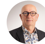
JEAN-LUC GRÉGOIRE 2 e VICE-PRÉSIDENT EN CHARGE DE LA PROTECTION DE LA RESSOURCE EN EAU

Dossier spécifique du mandat : garantir la performance du réseau de distribution de l'eau potable à travers notamment le renouvellement de 60 000 mètres de canalisation par an en moyenne.